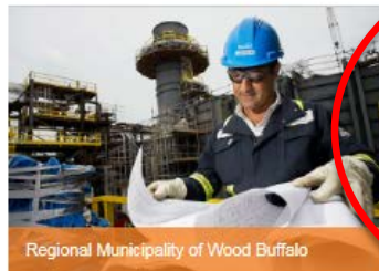
Regional Municipality of Wood Buffalo