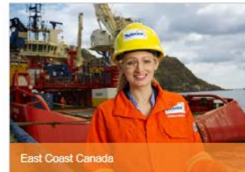
East Coast Canada